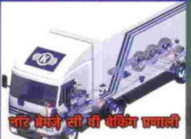
नॉर ग्रेमले सी वी बेकिंग प्रणाली