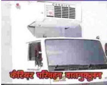
करीयर परिवहन वाहनमुफ्त