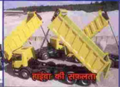
हाईवा की सफलता