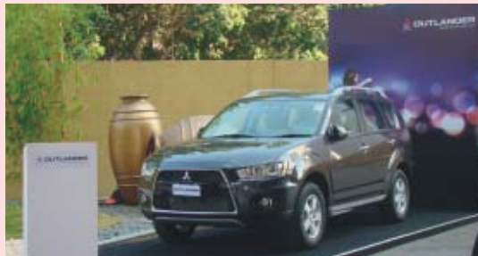
An Outlander beams proudly at the fashion week venue

Outlander has become almost synonymous with high fashion since its 2010 launch when Rohit Bal, one of India's leading fashion designers, unveiled the exclusive Outlander Signature Collection reflecting the style, power and charisma personified by the stylish SUV.