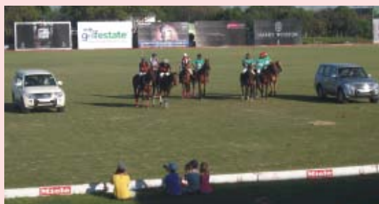
Monteros escorting players to the polo match

HM-Mitsubishi was the associate sponsor of Indian Masters Polo Tournament 2011. A unique concept was ideated by our marketing team wherein the Mitsubishi Monteros escorted