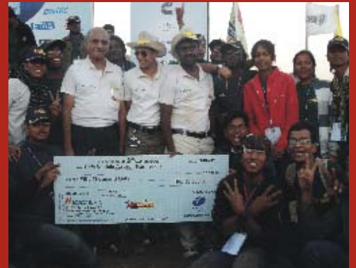
Celebrations after winning the safest vehicle runner-up award