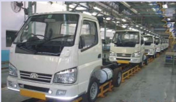
Winner CNG assembly line