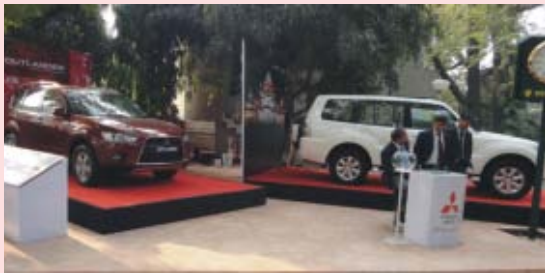
Vehicles at display at Delhi Golf Club

HM-Mitsubishi participated in a host of glitzy and star-studded events in a bid to promote its high-end sports utility vehicles (SUVs) and sports sedans. The initiatives were undertaken as part of a brand-building strategy to position Mitsubishi vehicles as a premium, chic and classy brand, among the high profile audience.