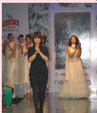
Designer Neeta Lulla with her models at the Outlander-sponsored fashion show