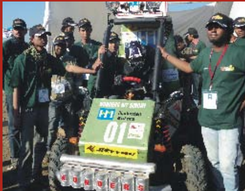
An enthused BIT team with HM-branded buggy Wonders

BIT Sindri's buggy Wonders featured the HM logo on all its sides. The T-shirts worn by members of the team and their banners also sported HM logo and name prominently. The team won the safest vehicle runner-up award, certificate of appreciation and a trophy along with prize money of Rs. 50,000. The event having been covered by auto magazines like Overdrive, Autocar India, Car n Style, Auto India etc., HM gained ample branding and publicity amongst auto engineering students and experts.